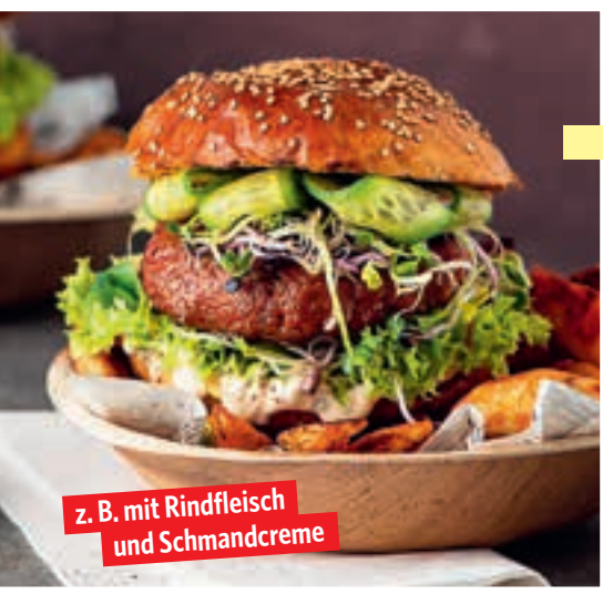
z. B. mit Rindfleisch und Schmandcreme

Genial gesund: Power-Burger Mit und ohne Fleisch s. 40